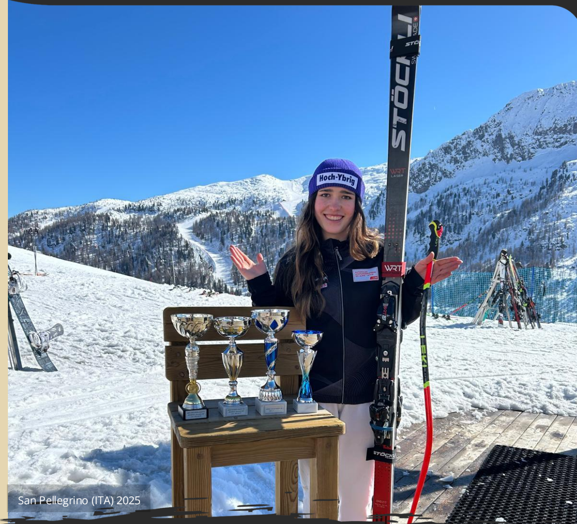
San Pellegrino (ITA) 2025