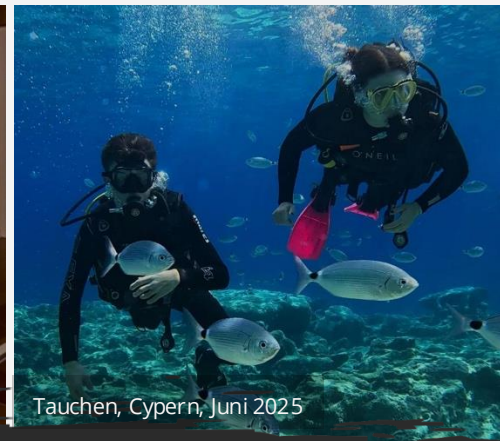
Tauchen, Cypern, Juni 2025