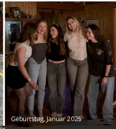
Geburtstag, Januar 2025