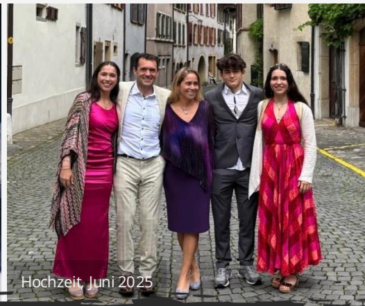
Hochzeit, Juni 2025