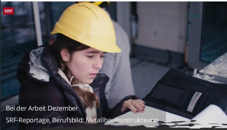
Bei der Arbeit Dezember SRF-Reportage, Berufsbild: Metallbaukonstrukteurin